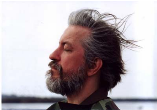
Stark, fantasievoll und unvergessen: der estnische Komponist Lepo Sumera

Tragisch früh, im Alter von 50 Jahren, verstarb Lepo Sumera im Jahr 2000. Immer noch ist er im Westen weit unbekannter als Arvo Pärt oder sein Schüler Erkki-Sven Tüür, was als grobe Ungerechtigkeit zu werten ist. Seine seit Beginn der achtziger Jahre entstandenen ersten fünf Symphonien, international herausragende, freisinnige Meisterwerke des unsterblichen