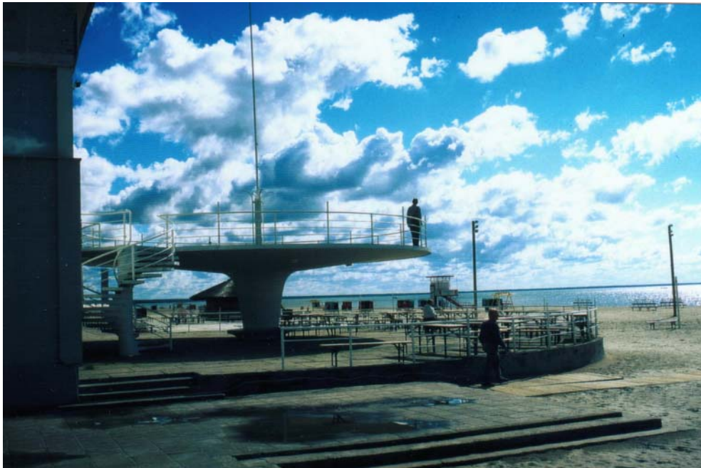
STRANDIDYLL IN PÄRNU, wo einst auch Größen wie David Oistrach zur Kur gingen.

Informationsblatt der Deutsch-Estnischen Gesellschaft e.V.