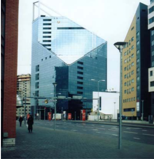
Markante Akzente im neuen architektonischen Profil der estnischen Hauptstadt Tallinn

Nach der Rückkehr aus Lettland und Litauen fiel auf, dass es im sonst so gastlichen Estland im Gegensatz zu den beiden Nachbarländern noch kaum einladende Rasthäuser an den Fernstraßen gibt wie dort. Auch in Tartu sind die Wiederherstellungsarbeiten vorangekommen. So erstrahlt das klassizistische Hauptgebäude der Universität in neuem Glanz, dagegen steht inzwischen das alte Anatomische Institut auf dem Domberg leer und droht zu verfallen.