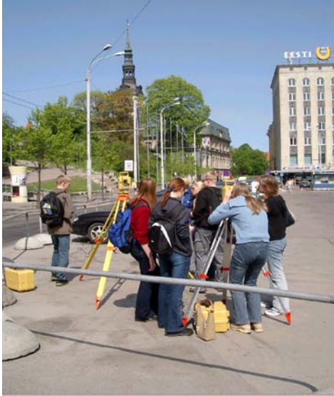
Vermessungsstudien in der Altstadt

xamenübung in Straßenvermessung. Es werden die Koordinaten und die Höhe der Nikolaikirche bestimmt. Vielleicht denken Sie, dass Turmhöhenbestimmung nicht Gegenstand des Lehrplans Straßenvermessung ist. Nun, Schnitte zwischen Kreisen und Geraden kommen bei der Einrechnung von Trassen vor. Die Vermessung eines Turmes erfordert ebenfalls den Schnitt zweier Geraden.